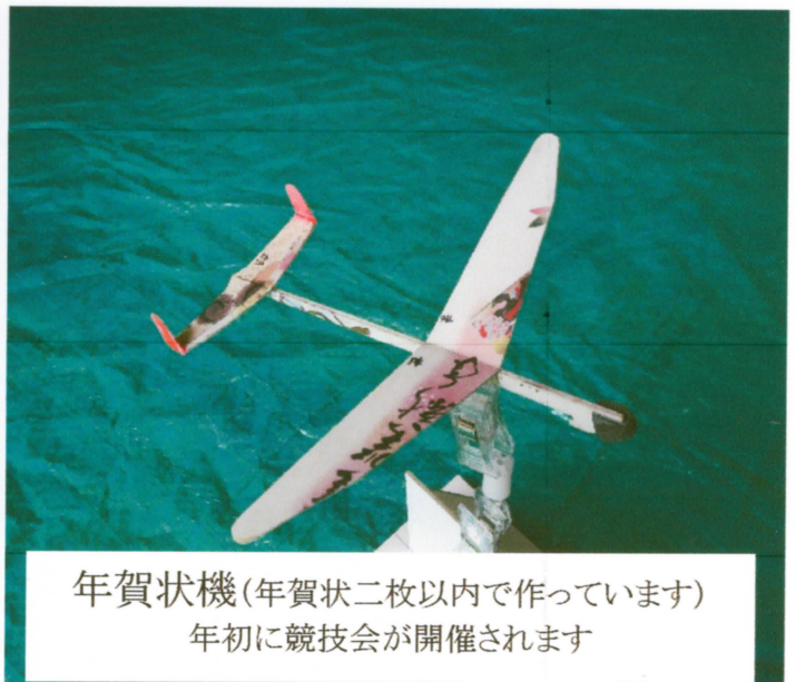
年賀状機(年賀状二枚以内で作っています) 年初に競技会が開催されます