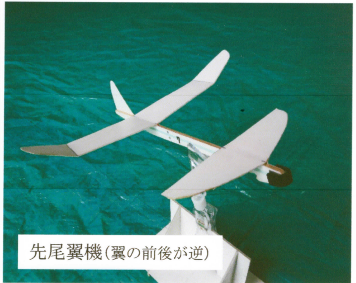
先尾翼機(翼の前後が逆)