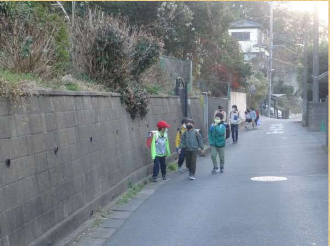
通学中の小学生たち