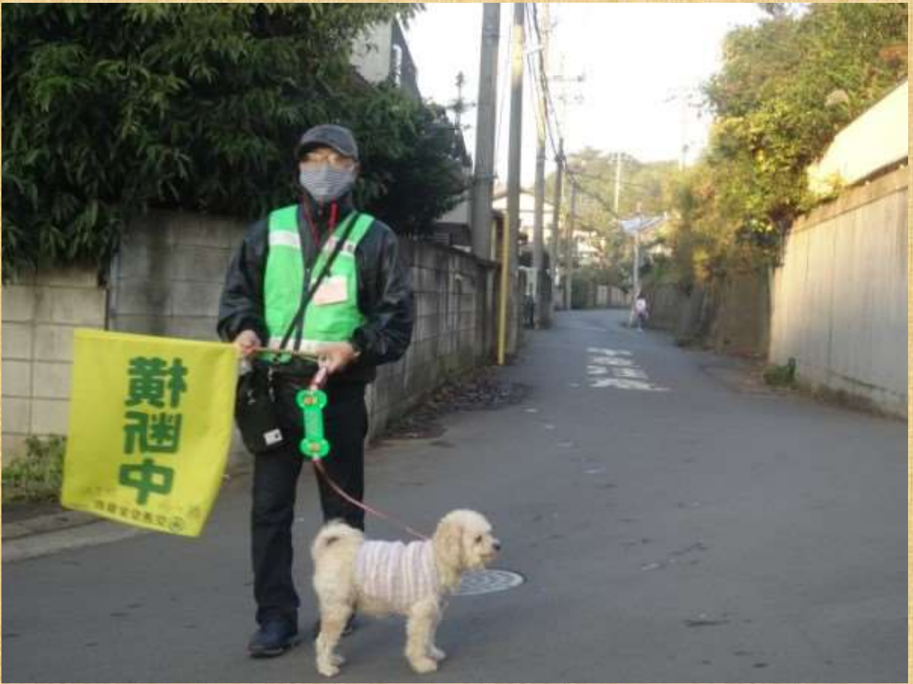
わんわんパトロール、実施中!!