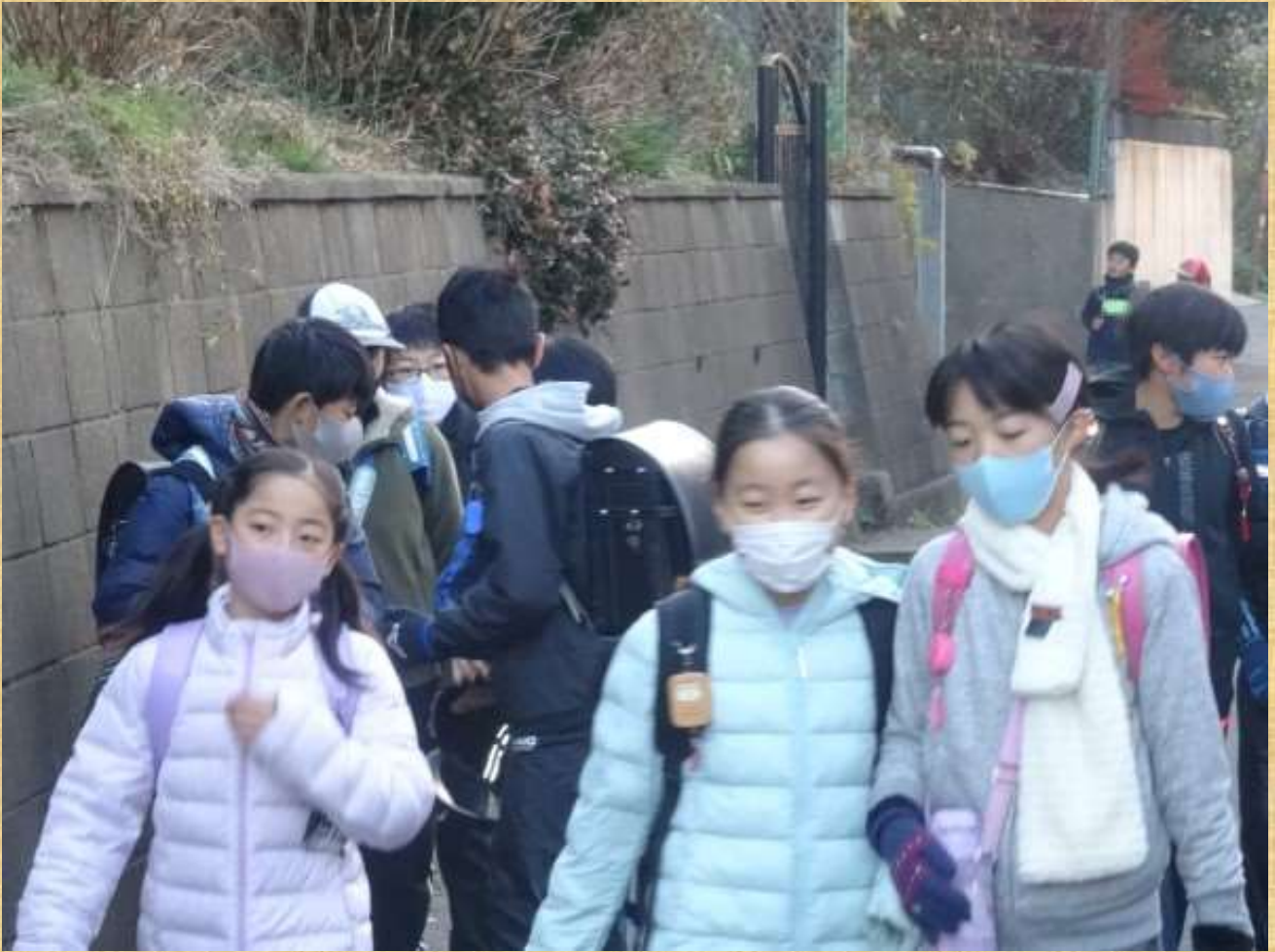
通学中の小学生たち