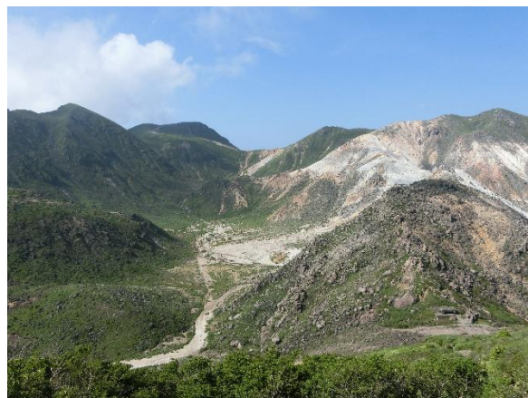
三俣山から望む久住山(正面奥)、硫黄山(右)

なお「くじゅう連山」とひらがなで表記するのは、この山々が九重町(ここのえまち)と久住町(くじゅうまち)に位置するので、両者に配慮し「くじゅう」とひらがな表記になったそうです。