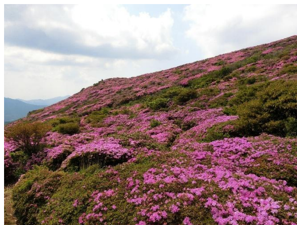
大戸越から見上げた平治岳

着くと早速温泉へ。頭からお湯をかぶりザッブーンと…。環境保護の観点から石鹸は使えませんが汗を流しお湯に浸ればそれで満足。鼻歌もでる湯加減でした。湯か