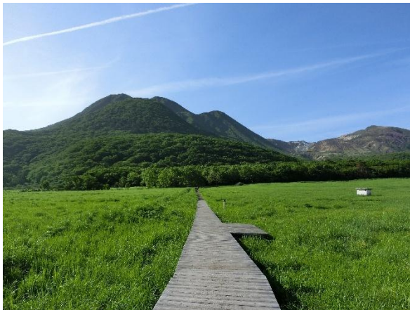
タデ原湿原、正面は三俣山

4時起床、朝食を済ませ登山口の長者原へ向かいました。車を走らせること1時間、5時半と言うのに駐車場は7割の混雑。準備運動後目的地の平治岳を目指しました。